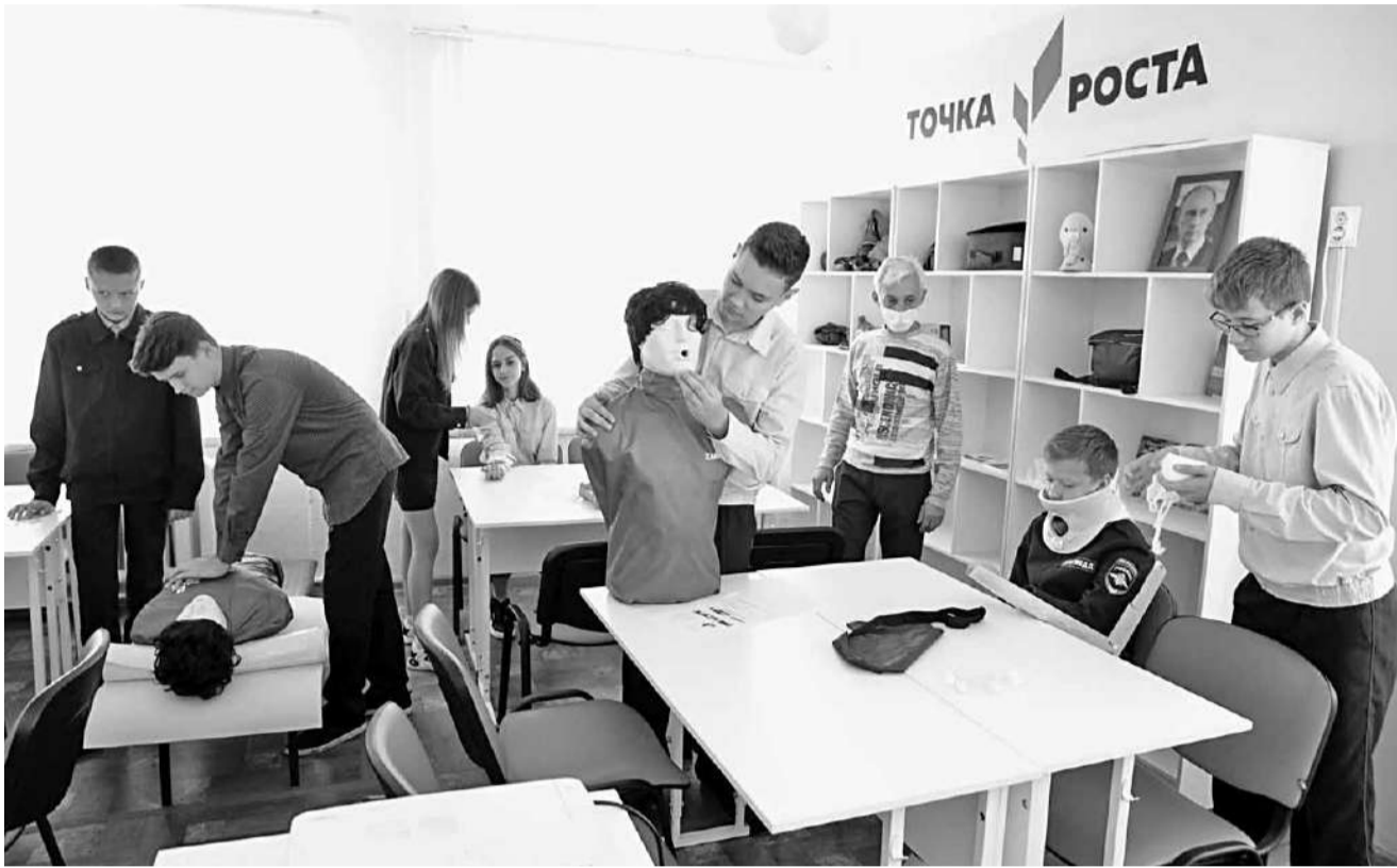
Занятия по оказанию первой медицинской помощи

Конечно, «Точкой роста» сейчас никого не удивишь. В Белгородской области уже привыкли, что даже небольшие сельские школы постепенно оснащаются современным оборудованием, а ребята учатся программировать, конструировать, управлять квадрокоптерами и легко осваивают цифровую технику.