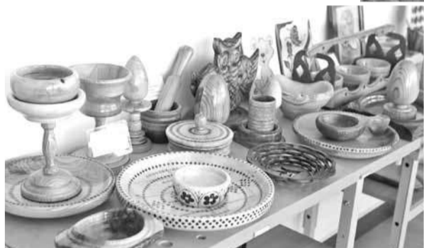
Изделия из дерева, сделанные школьниками на уроках технологии