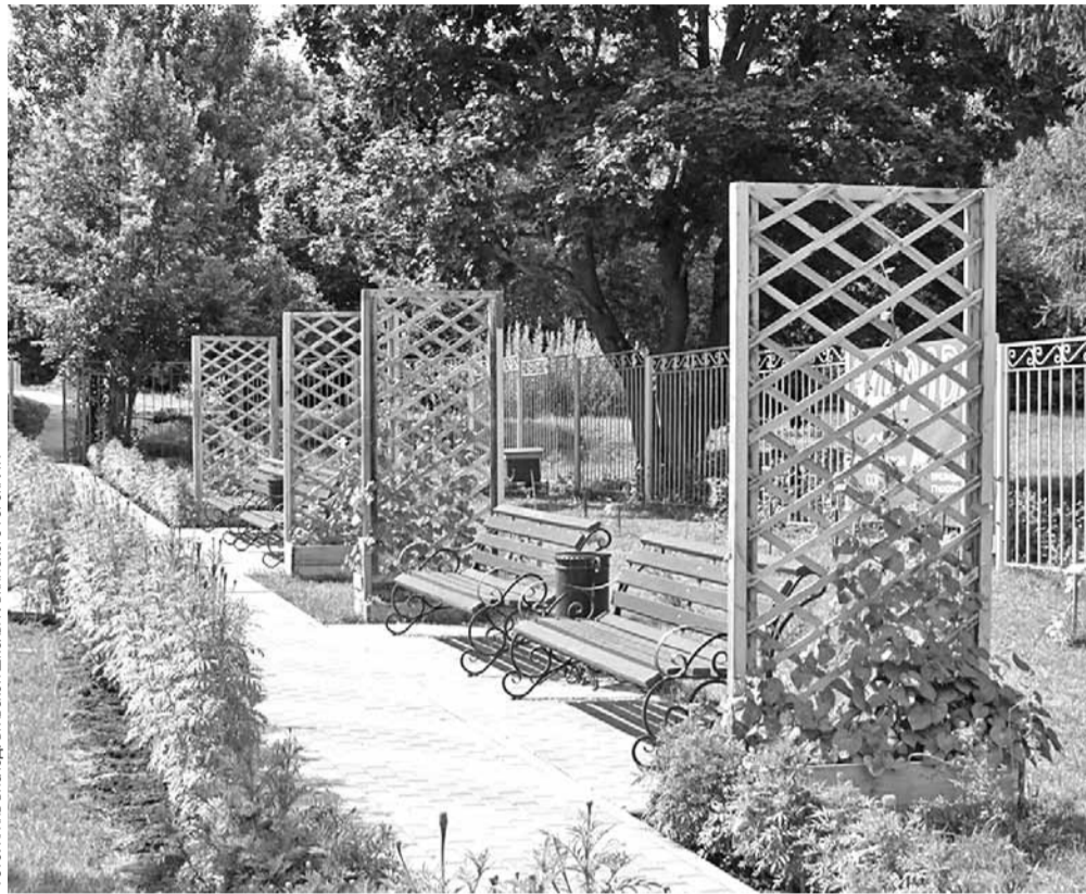
Вислудубравская школа Губкинского горокруга