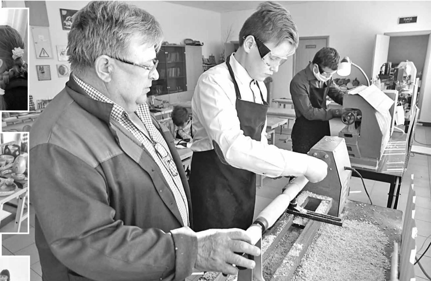
На уроке технологии в школьной мастерской

— С пятого класса я веду у ребят технологию, начинаем с самого простого — строгания древесины. После дерева постепенно переходим к работе